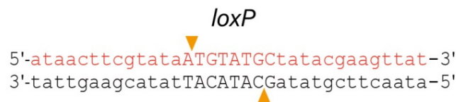
图1. loxP位点序列图。Cre重组酶与两端13bp反向重复序列(小写字母)结合, 中间是8bp不对称中心间隔区(大写字母), 箭头所示为Cre重组酶的酶切位点。